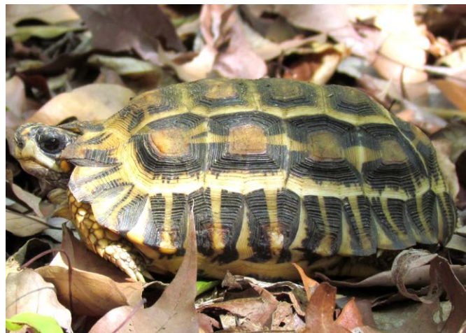
Tortue à queue plate

Les appuis de la FAPBM pour l'unité de gestion de la Réserve d'Andranomena se font par le biais du Sinking Fund et ont débuté en 2021 . Pour les aires protégées gérées par MNP, la FAPBM assure la sécurisation des charges salariales et de quelques frais de fonctionnement.