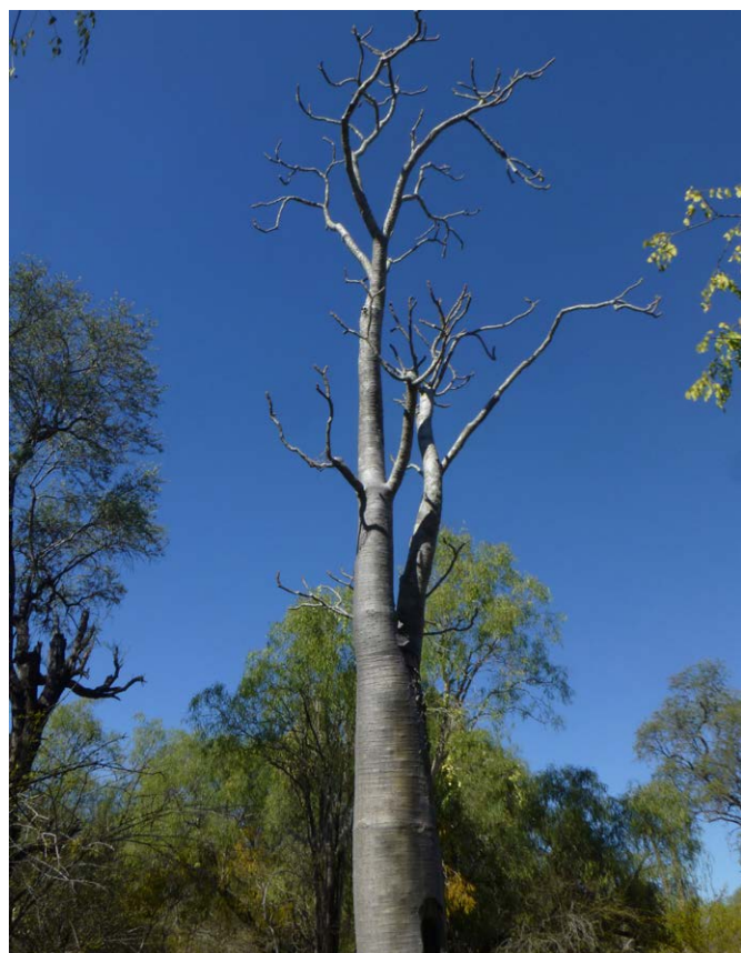
Aschrochelys radiata

Pour les AP gérées par MNP, la FAPBM assure la sécurisation d'une partie des charges salariales et de quelques frais de fonctionnement .