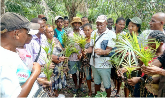
Complexe Mahavavau Kinkonky

Dans le cadre de la nouvelle gouvernance des aires protégées, le MEDD initie actuellement une réforme du CGES des aires protégées (AP). Ceci vient à la suite de l'atelier national sur la conciliation de la sauvegarde sociale et réduction de la pauvreté, organisé de pair par le Laboratoire de Recherche Agronomiques (LRA) – ESSA Forêts et l'université de Bangor, sous le parrainage du MEDD, en octobre 2020. Plusieurs outils sur la thématique ont déjà été mis en place (ONE, MEDD, etc.). Et ce nouveau cadre ambitieux de répondre aux failles de l'existant, soulevées par les études présentées et les échanges réalisés pendant cet atelier.